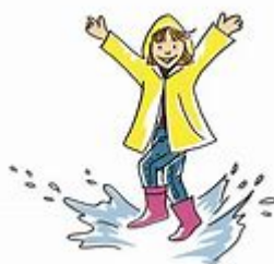
Figur 1 bild på ett barn i gul regnkappa som stäcker sina armar i höjden och hoppar i en vattenpöl.

Gör ni resor, möten, annan verksamhet eller något annat kul, skriv gärna ner några rader och skicka det till kansliet till SKB Nytt, det är alltid trevligt och kan ge andra lokalföreningar tips om trevliga aktiviteter.